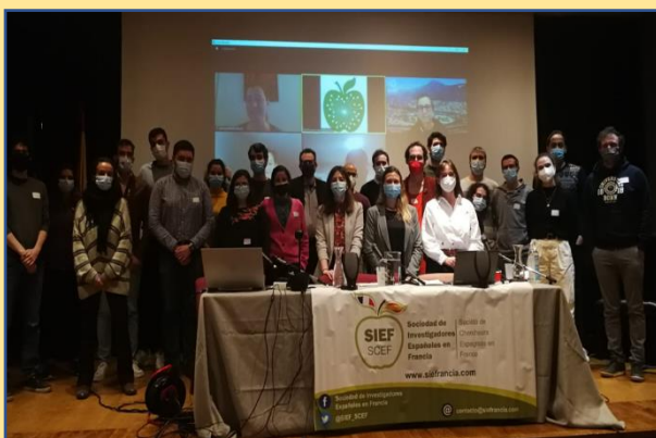
Junta directiva y socios del SIEF en la AG Celebrada en diciembre 2021

contacto@siefrancia.com - paris@siefrancia.com - https://siefrancia.com/