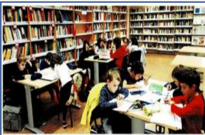
Alumnado del aula de Paris V trabajando en el centro

CLASES DE LENGUA Y CULTURA ESPAÑOLAS PROGRAMA ALCE, UNA HERRAMIENTA FUNDAMENTAL PARA NUESTROS HIJOS Y NIETOS